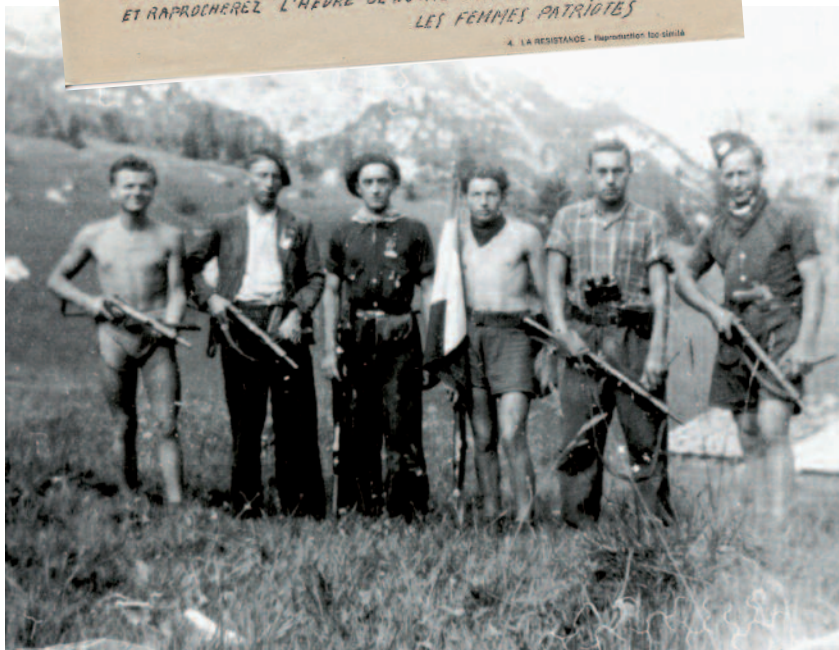
Groupe de maquisards, 1943